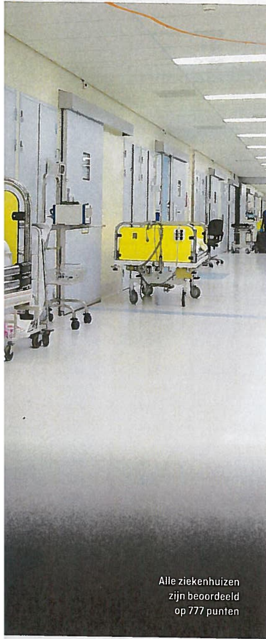
Alle ziekenhuizen zijn beoordeeld op 777 punten